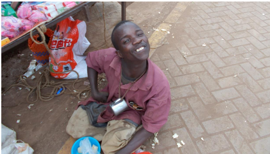
Det kryr av tiggere, ikke som de i Norge og ellers i vesten, men du ser umiddelbart at de er hjelpetrequende, men blide er de tross sin skjebne