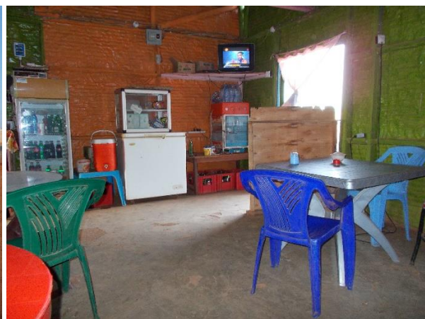
inne i den første opprettede kaféen