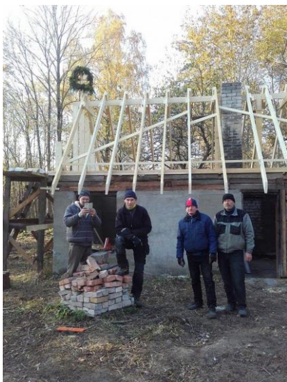
Figur 1 «hytta» og arbeiderne.