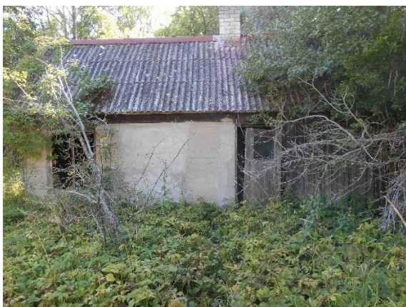
«hytta» slik den var før renovering

Et av småhusene på eiendommen er blitt fullrenovert og fungerer i dag som en utleiebolig.