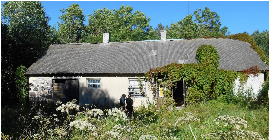
Hovedhuset på eiendommen i Haapsalu

I Haapsalu er det blitt kjøpt et gammelt småbruk med tilliggende skogsareal.