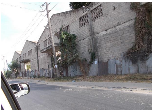
feilslåtte investeringer som har stått halvferdige siden 1970-tallet

For å illustrere forskjellen mellom fattige og rike i Kenya gir bildene under klar beskjed: