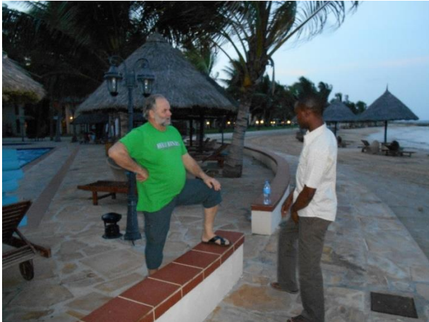
Leif Norli i prat med en av de lokale medarbeidere til jordbruksprosjektet i Tanzania!

Ved en tilfældighet ble Bruktbua tilknyttet et jordbruksprosjekt i Kibiti i Tanzania som var ledet av den kjente elverumsingen Leif Norli.