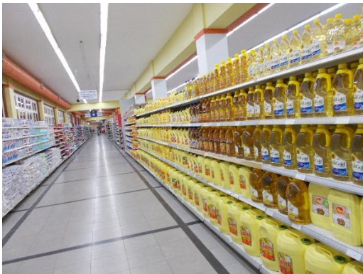
fra et kjøpesenter i Nairobi. Folketomt!

I klartekst kan det derfor uttrykkes på følgende måte. Ved å hjelpe direkte der behovet er, slik at de pengene som blir generert ikke umiddelbart suges opp i det samfunnsjiktet som kun investerer pengene i luksusprosjekter som de tror det vil være et marked for blant landets rike elite. En gang var det slik at U-hjelpen ukritisk flommet over de rike i landet