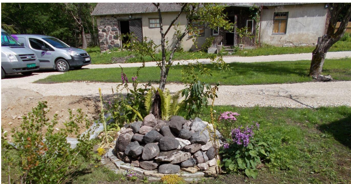
Sett fra utleieenheten.

Utleieenheten kan forøvrig finnes på booking.com. Søk på Haapsalu under overskriften «Karuvilla», eller trykk på linken :