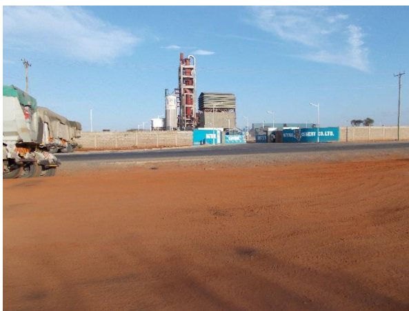
cementfabrikken nær Emali i Kenya

Rapporter over den økonomiske situasjonen i disse enhetene kommer jevnlig via messenger til Norge. De blir bearbejdet og analysert med tanke på å gi retning til den videre drift.