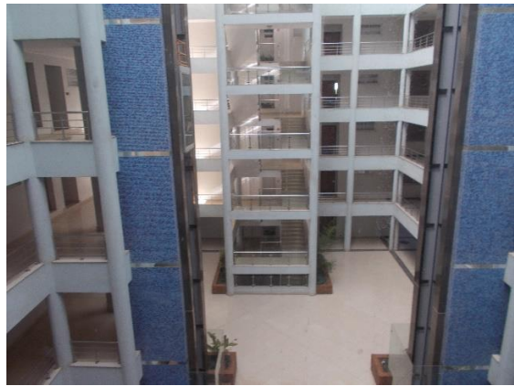
festningene med væpna vakter i porten beregnet på den rike overklassen som teller ca.1.mill.