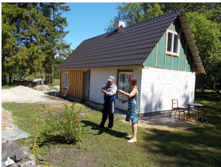
«hytta» nesten ferdig!